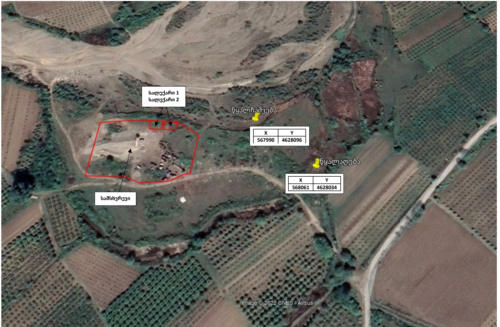
სურ. 1 - ტერიტორიის სიტუაციური რუკა