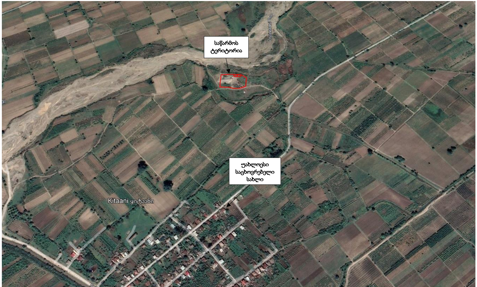
სურ. 2 ტერიტორიის სიტუაციური რუკა